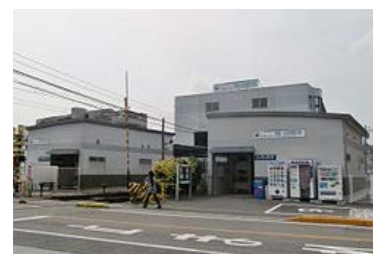
名鉄犬山線 徳重・名古屋芸大駅